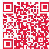
Video zur Registrierung