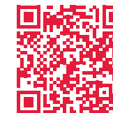
AKBK – Koch/Köchin

Weitere Informationen zur Einschulung veröffentlichen wir im Laufe der Sommerferien auf unserer Homepage.